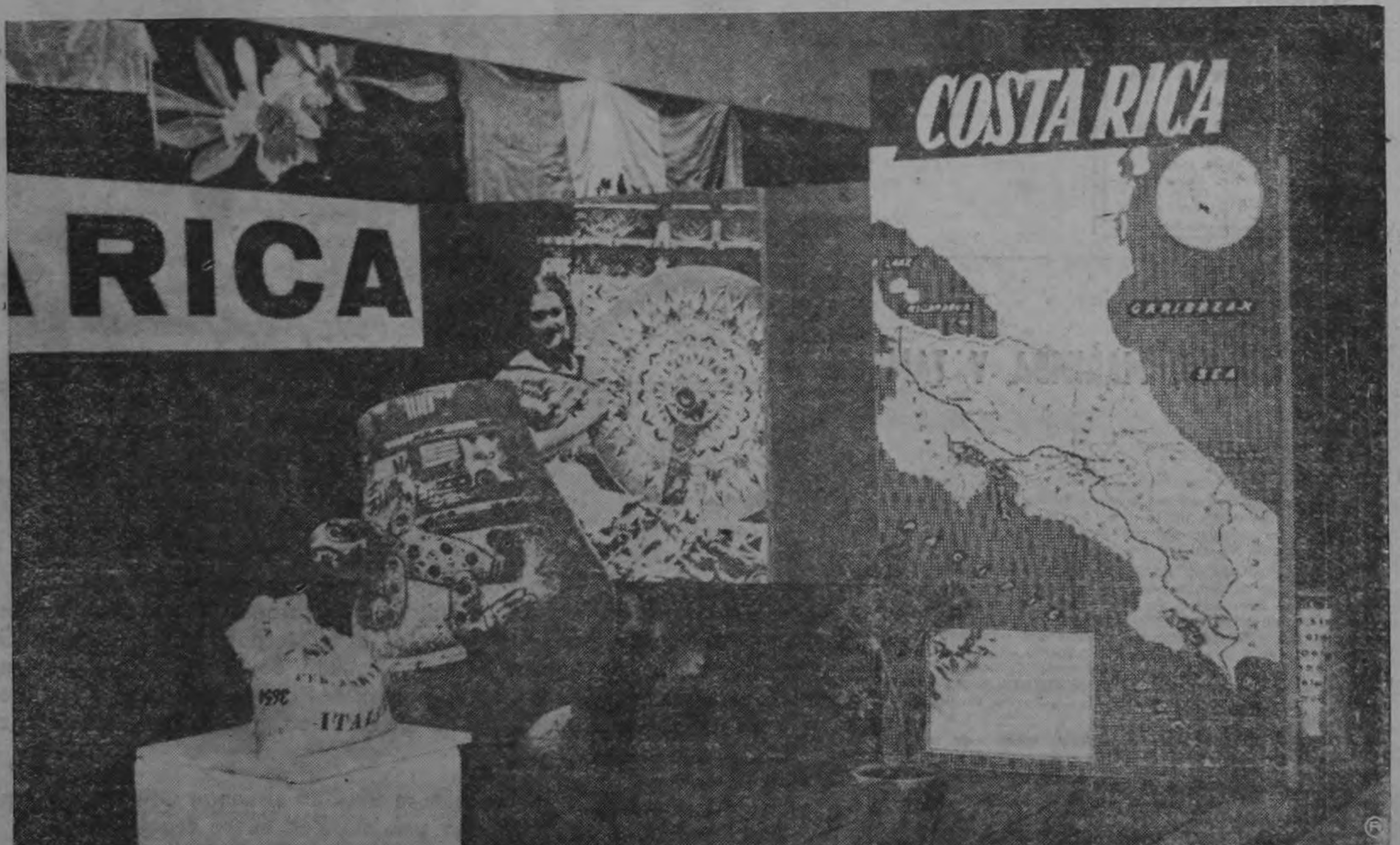
COSTA RICA EN EL EXTRANJERO. —Stand de Costa Rica en la Feria del Mediterráneo celebrada en el pasado mes de junio en la ciudad de Palermo, Sicilia. El programa incluyó una Exposición Internacional de Productos, en la cual participó nuestra Oficina del Café. La muestra costarricense fué arreglada con evidente buen gusto: el saco de café está acompañado por interesantes motivos típicos. No faltan la guaria ni las típicas cassetas, y hay también un mapa de la patria, y, amañera de eslabón con el pasado, un hermoso jarrón de cerámica chorotega.