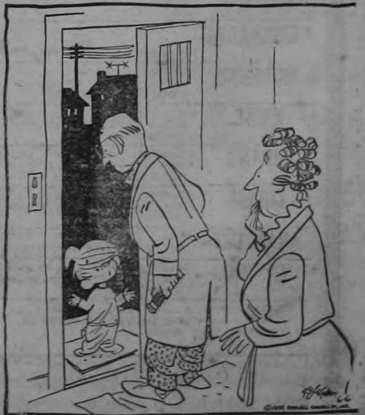
¿Quieren que les haga la visita? Papá y mamá se fueron ya a acostar...